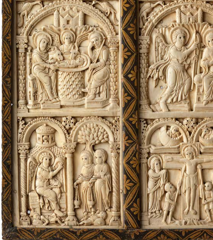
Harrach-Diptychon, Hofschule Karls des Großen, Aachen, um 800, Elfenbein, Leihgabe der Peter und Irene Ludwig Stiftung, Aachen