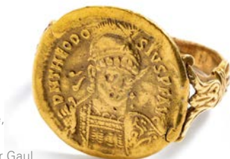
Fingerring mit byzantinischer Goldmünze, Levante, 7. Jahrhundert