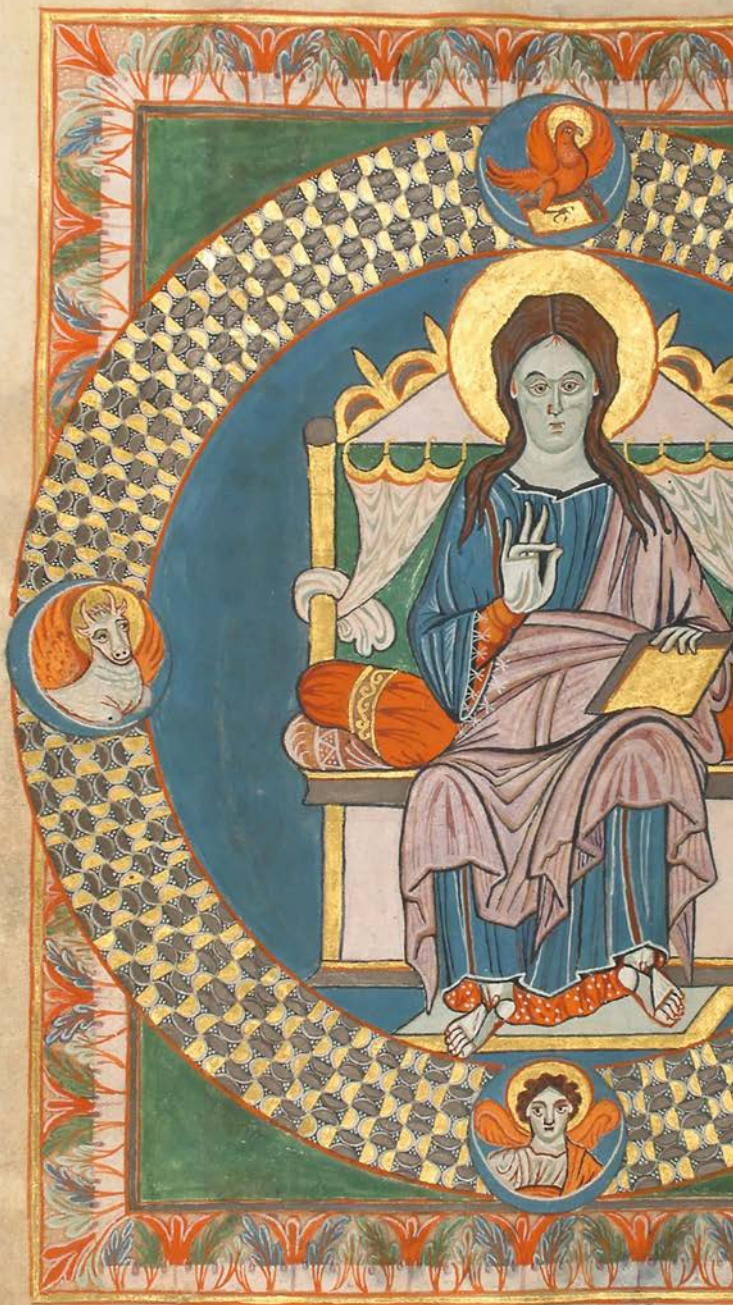
Majestas Domini, Gero-Codex, Kloster Reichenau, vor 969